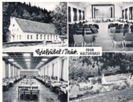
Kulturhaus Gießbübel KS 972

20.03.1971 Gießbübel . An diesem Wochenende trafen sich im Kulturhaus Gießbübel die Mitglieder von 29 Tanzkapellen des Kreises zu einem großen Tanzmusikfest, bei dem auch die Einstufung der Kapellen vorgenommen wurde. Dabei waren auch zwei Tanzkapellen der Grenztruppen.