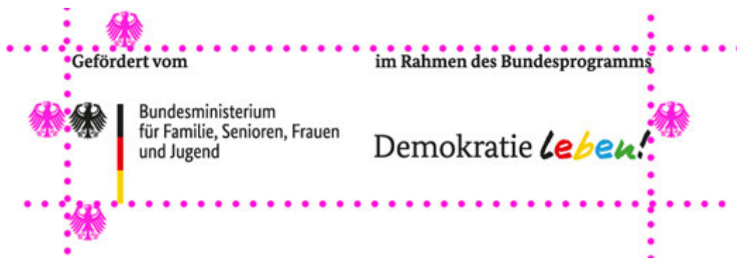
Illustration: Schutzraum um das Logo

in der kein anderes Element platziert werden darf. Die Schutzzone hat zu jeder Seite hin die Breite von einem Adlerelement.