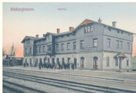
Bahnhof Hildburghausen 01-022

Verspätungen nachzuspüren und u.U. mit rücksichtsloser Härte darauf zu dringen, daß derartige Übel behoben werden. Das Publi-kum hat für sein teures Geld ein Recht darauf, pünktlich befördert zu werden.“