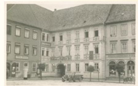
Englischer Hof 12/53