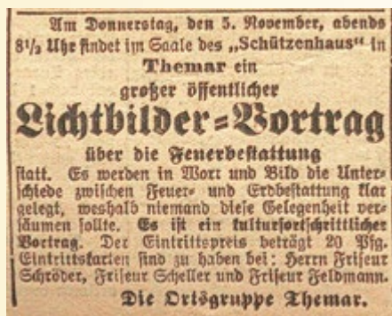
Anzeige Lichtbildervortrag Feuerbestattungen

01.11.1925, Themar , 30. Oktober. Der Feuerbestattungsverein Suhl, Ortsgruppe Themar hält am 5. Nov. Abends ½ 9 Uhr, im Schützenhaus einen öffentlichen Lichtbildvortrag. Die Feuerbestattung findet in letzter Zeit immer mehr Anhänger und Freunde, die Mediziner empfehlen sie aus sanitären Gründen, zahlreiche Vereine werben dafür. In dem Vortrag soll der Unterschied zwischen Erd- und Feuerbestattung an Hand von Lichtbildern gezeigt werden.“