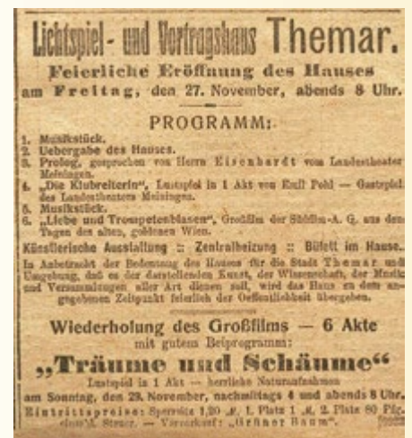
Anzeige Lichtspiel- und Vortragshaus

25.11.1925 „ Themar , 23. November. Unser neues Lichtspiel- und Vortragshaus öffnet, wie aus dem Anzeigenteil hervorgeht, am Freitag seine Pforten. An diesem Abend kommt der beliebte Film „Liebe und Trompetenblasen“ zur Vorführung. Das „Filmecho des Berliner Lokalanzeigers“ schreibt: Man muß zugeben, daß es sich hier um einen der amüsantesten, nettesten, gelungensten Filme der letzten Zeit handelt....“