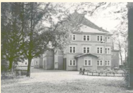
Stadttheater vom Park her, aus Stadt Hildburghausen Sign. 7228

20.11.1925 „ Hildburghausen , 19. November. Die hiesige Bürgerschule hatte die Absicht, in diesem Winter die Eltern und Freunde ihrer Schüler wieder einmal durch eine Theateraufführung zu erfreuen. Mit großer Begeisterung und ernstem Fleiß hatten sich die Kleinen schon an die Arbeit gemacht. Da aber das ausgewählte Stück große Kindergruppen auf die Bretter stellt und zur Aufführung nur die Bühne des Stadttheaters mit ihren Nebenräumen in Frage kommt, so muß leider von der Aufführung abgesehen werden, da nach Beschluß des Gemeinderates das Stadttheater nur noch an Berufsschauspieler abgegeben wird.