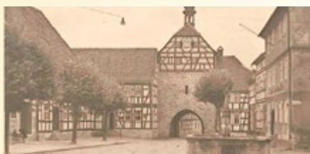
Heldburg KS 269