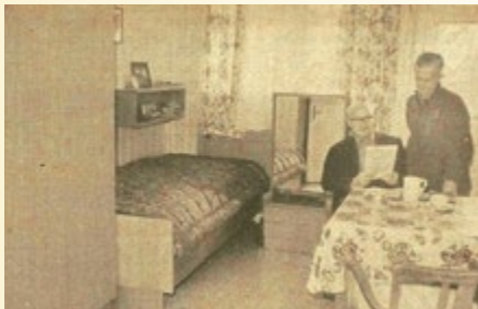
Zimmer im Pflegeheim Bockstadt

27.01.1976 Bockstadt. Dank finanzieller und materieller Unterstützung konnte im vergangenen Jahr das Pflege- und Feierabendheim Bockstadt vollständig renoviert werden. Mit einem Kostenaufwand von über 100 000 Mark wurden z.B. sämtliche Zimmer und Flure mit neuem Fußbodenbelag versehen, in allen Zimmern Kalt- und Warmwasserleitungen installiert und neu tapeziert. Ein großer Teil konnte außerdem mit neuen Möbeln ausgestattet werden. Alle Arbeiten wurden bei einer 92prozentigen Belegung durchgeführt und brachten vor allem für das Personal große Belastungen.