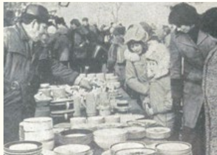
Kalter Markt in Römhild

31.01.1976 Römhild. Am vergangenen Donnerstag kamen aus vielen Orten im Umkreis von Römhild Schau- und Kauflustige zum traditionellen „Kalten Markt“. Der stets am letzten Donnerstag im Januar stattfindende Markt, bietet ein reichhaltiges Sortiment an Haushaltswaren, Spielwaren und Porzellanerzeugnissen. Gefragte Artikel waren die beliebten Keramik- und Tonprodukte aus dem Grabfeldgebiet. Auch der dazugehörige Taubenmarkt mit seiner reichen Auswahl an Zucht- und Schlachttauben lockte viele Interessenten an.