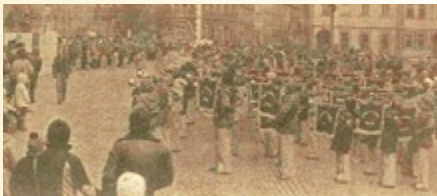
Musikschaus auf dem Markt

10.03.1976 Hildburghausen. Anlässlich der XX. Kreisdelegiertenkonferenz der FDJ gestalteten am späten Nachmittag 400 Mädchen und Jungen des Bezirksmusikkorps Suhl eine große Musikschaus. Zu ihnen gehören aus dem Kreis Hildburghausen das Zentrale Pionier- und FDJ-Blasorchester und der Fanfarenzug Ummerstadt.