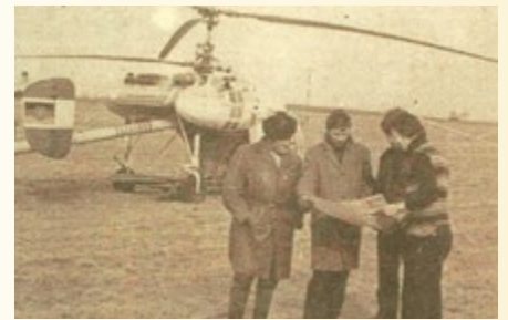
Einsatzberatung mit dem Piloten

19.03.1976 Kreisgebiet. Erstmals wird in unserem Kreis auch ein Hubschrauber der Interflug, Abteilung Agrarflug zu einem längeren Arbeitseinsatz stationiert. Die Besatzung soll im Auftrag des ACZ Hildburghausen für die Düngerversorgung von etwa 6600 Hektar absoluten Grünlandes an Hangflächen verantwortlich zeichnen. Rund 50 Prozent der geplanten Flugstunden im Bezirk werden in unserem Kreis geflogen. Des Weiteren werden die Hangflächen im Kreis Sonneberg, Neuhaus, Ilmenau und Suhl mit Dünger versorgt. Zwischen 40 und 50 Starts werden gegenwärtig bewältigt.