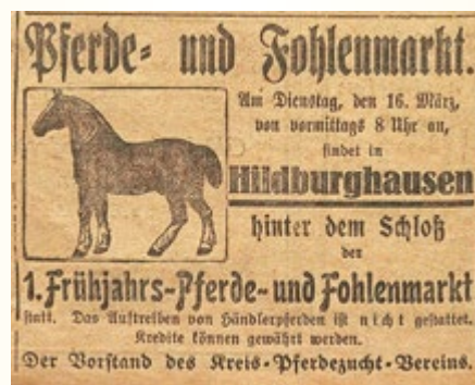
Anzeige Pferde- und Fohlenmarkt

17.03.1926 „Hildburghausen, 16. März. Pferdemarkt. Als der Markt heute vormittag 8 Uhr hinter der Kaserne eröffnet wurde, waren noch wenig Pferde da. Nach und nach hatten sich aber etwa 33 - 35 Pferde eingestellt, die zum Verkauf ausbezogen wurden.