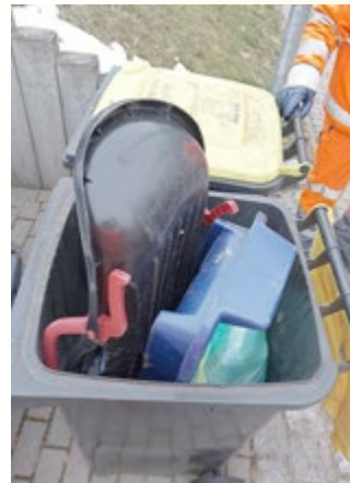
sperrige Abfälle gehören zum Sperrmüll