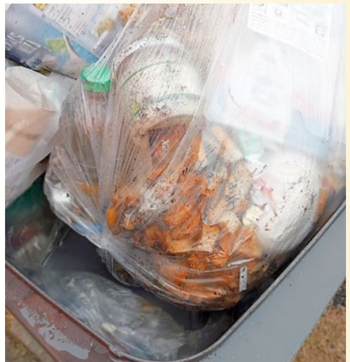
Nahrungsmittelreste gehören in die Biotonne oder auf den Kompost