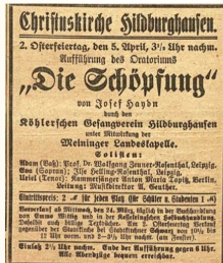
Anzeige Oratorium „Die Schöpfung“

„Die Schöpfung“ von Josef Haydn am 2. Osterfeiertag in hiesiger Stadtkirche aufzuführen.