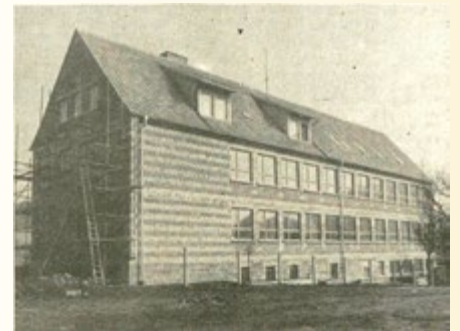
Neue Schule Lengfeld

entstanden. Auch die Gehwege wurden erneuert und ein neues Feuerwehrgerätehaus entstand. In wenigen Wochen kann der Unterricht in der neuen 10 klassigen Oberschule stattfinden. In der ehemaligen Schule werden neue Horträume geschaffen.