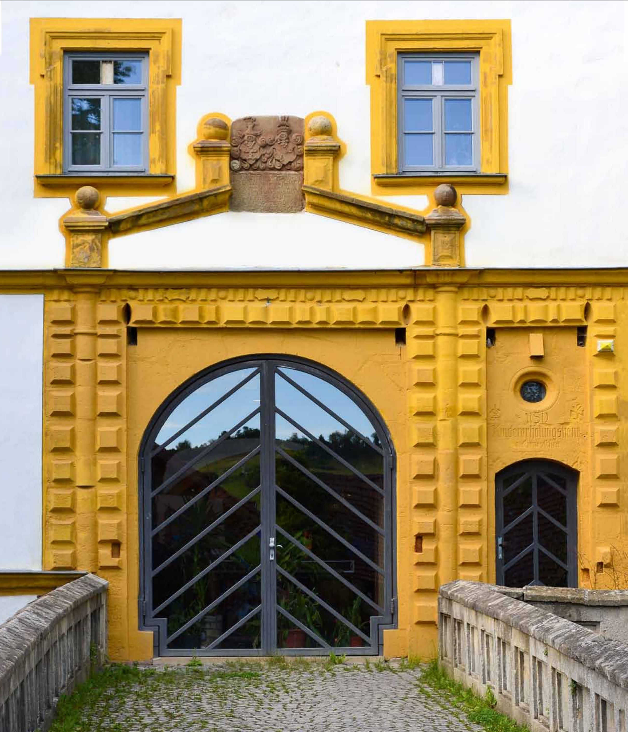
Portal des Schlosses in Marisfeld