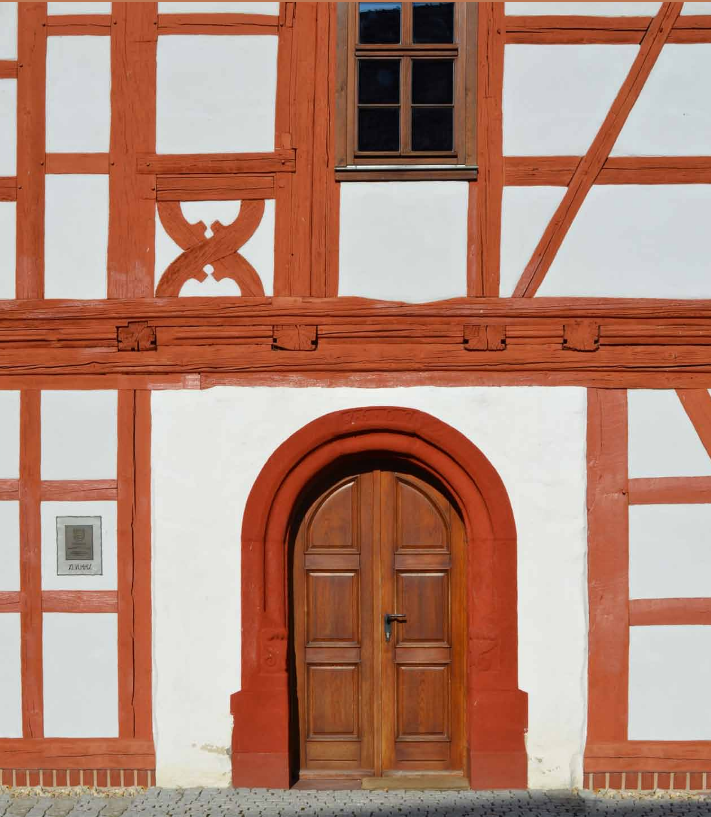
Brandköpshaus in Hinternah

Die Arroganz der Jugend. Ich war immer rebellisch, aber stets auf der Suche nach einem neuen Weg. Das war etwas Gutes. Doch wenn ich arrogant war und fand, die Alten hätten von nichts eine Ahnung, führte das stets dazu, dass ich viele Dinge nicht lernte. PAULO COELHO