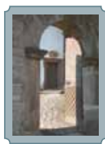
Portal des Kirchhofes von Leimrieth