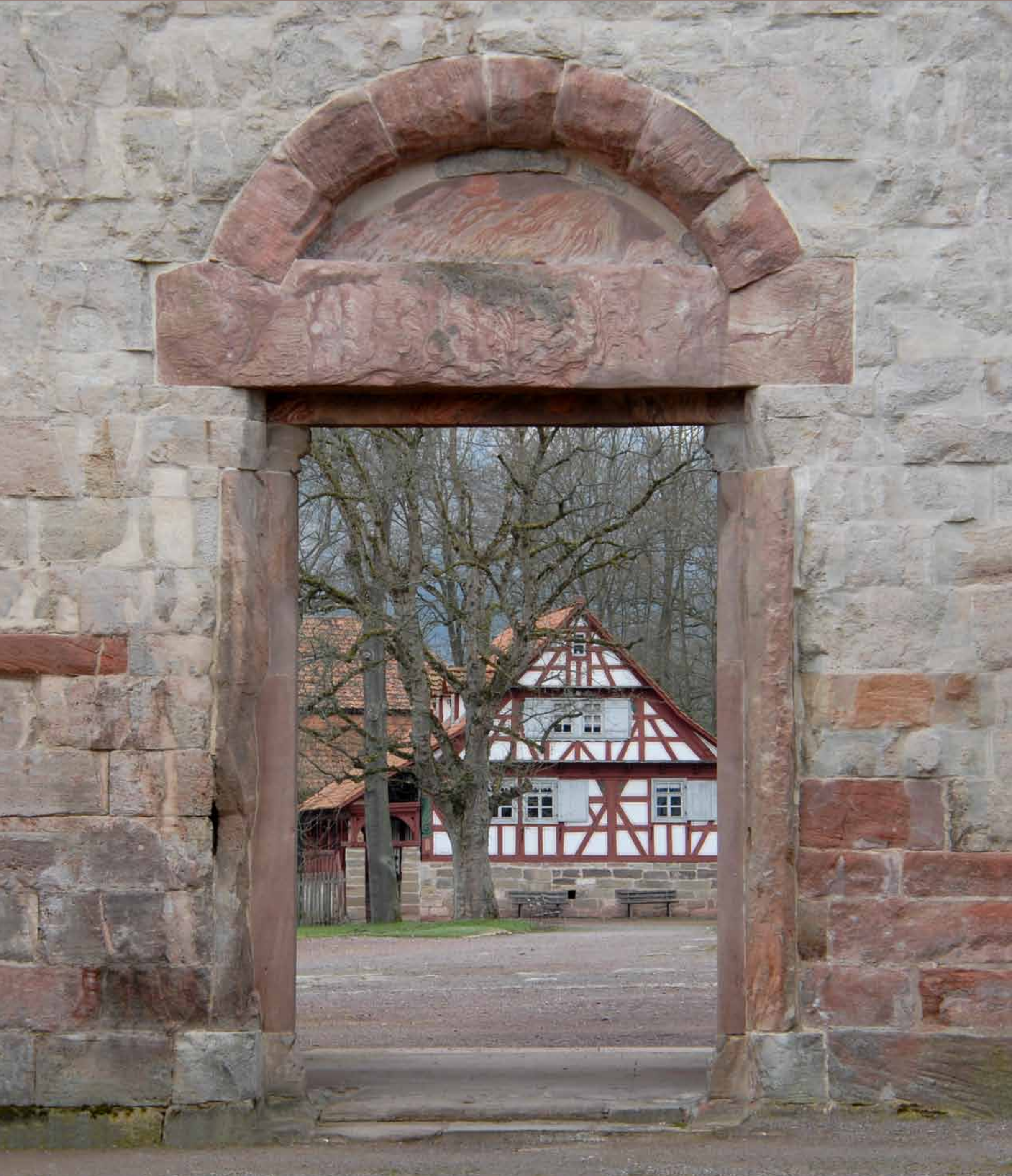
Romanisches Portal der Kirchenruine in Kloster Veßra

Warum müssen wir auf die Stimme des Herzens hören? Weil dort, wo unser Herz weilt, auch unser Schatz liegen wird. PAULO COELHO