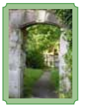
Portal im Museum Kloster Veßra