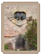
Barockfenster in Weitersroda