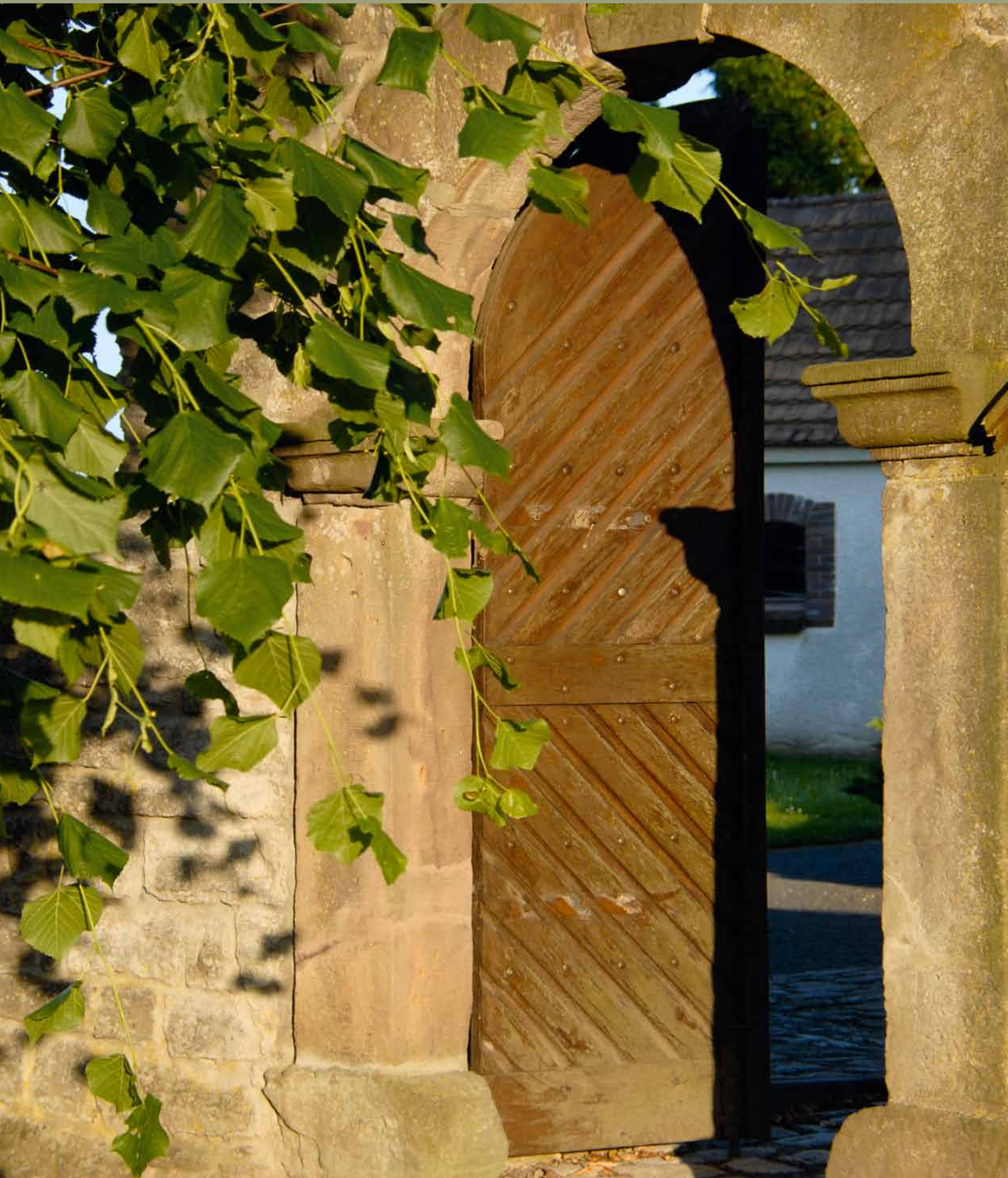
Eingang zum Kirchhof von Leimrieth

01 son 02 mon 03 die 04 mit 05 don 06 fre 07 sam 08 son 09 mon 10 die 11 mit 12 don 13 fre 14 sam 15 son 16 mon 17 die 18 mit 19 don 20 fre 21 sam 22 son 23 mon 24 die 25 mit 26 don 27 fre 28 sam 29 son 30 mon