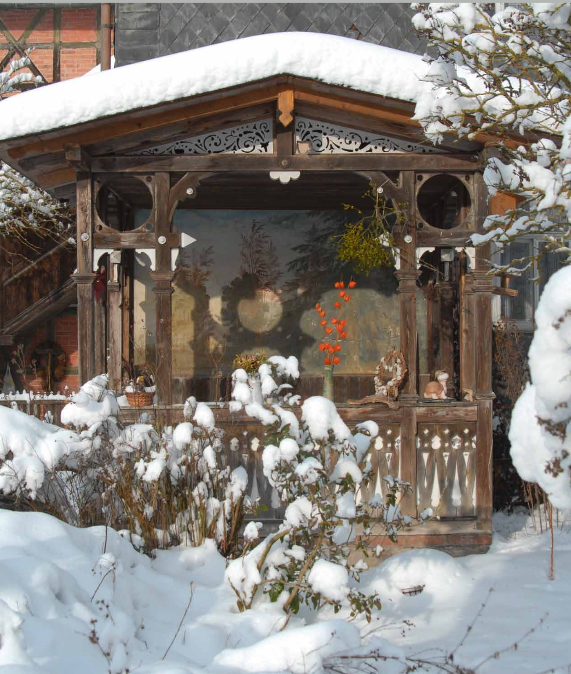
Bauernlaube an der Mühle Bockstadt