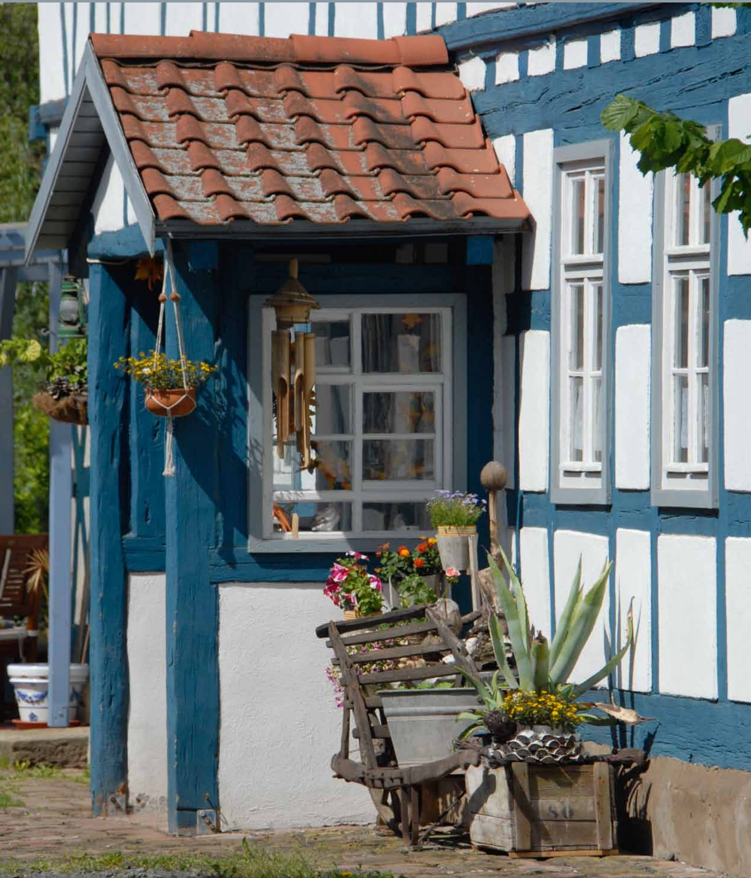
Wohnhaus in Seidingstadt

Die Menschen haben keine Zeit mehr, irgend etwas kennenzulernen. Sie kaufen sich alles fertig in den Geschäften. ANTOINE DE SAINT-EXUPÉRY