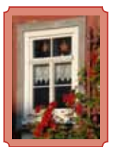
Wohnhaus in Milz