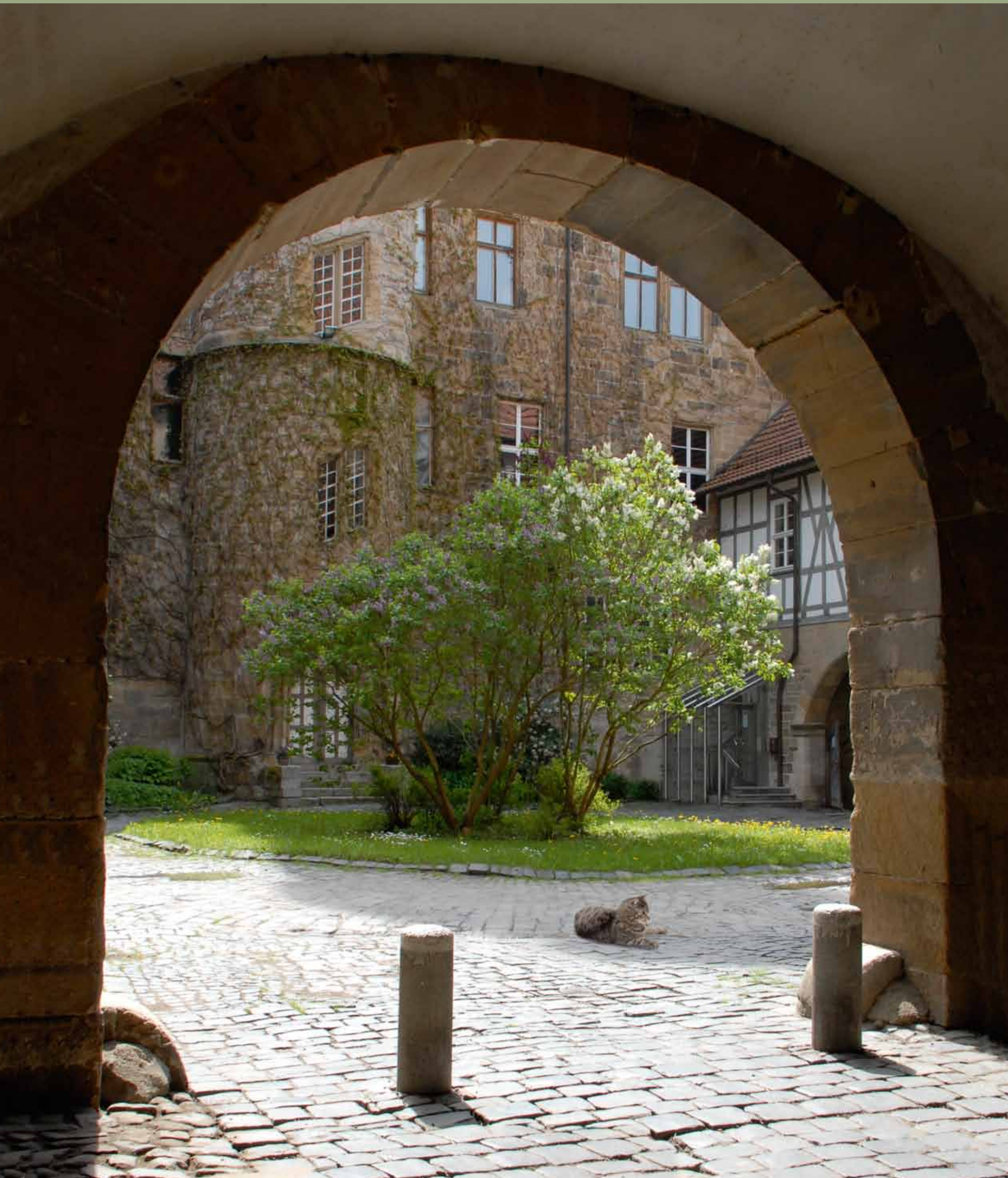
Blick in den Schlosshof der Glücksburg in Römhild

Offen stehen Fenster, Türen, draußen Frühlingsboten schweben, Lerchen schwirrend sich erheben, Echo will im Hof sich rühren. JOSEPH V. EICHENDORFF