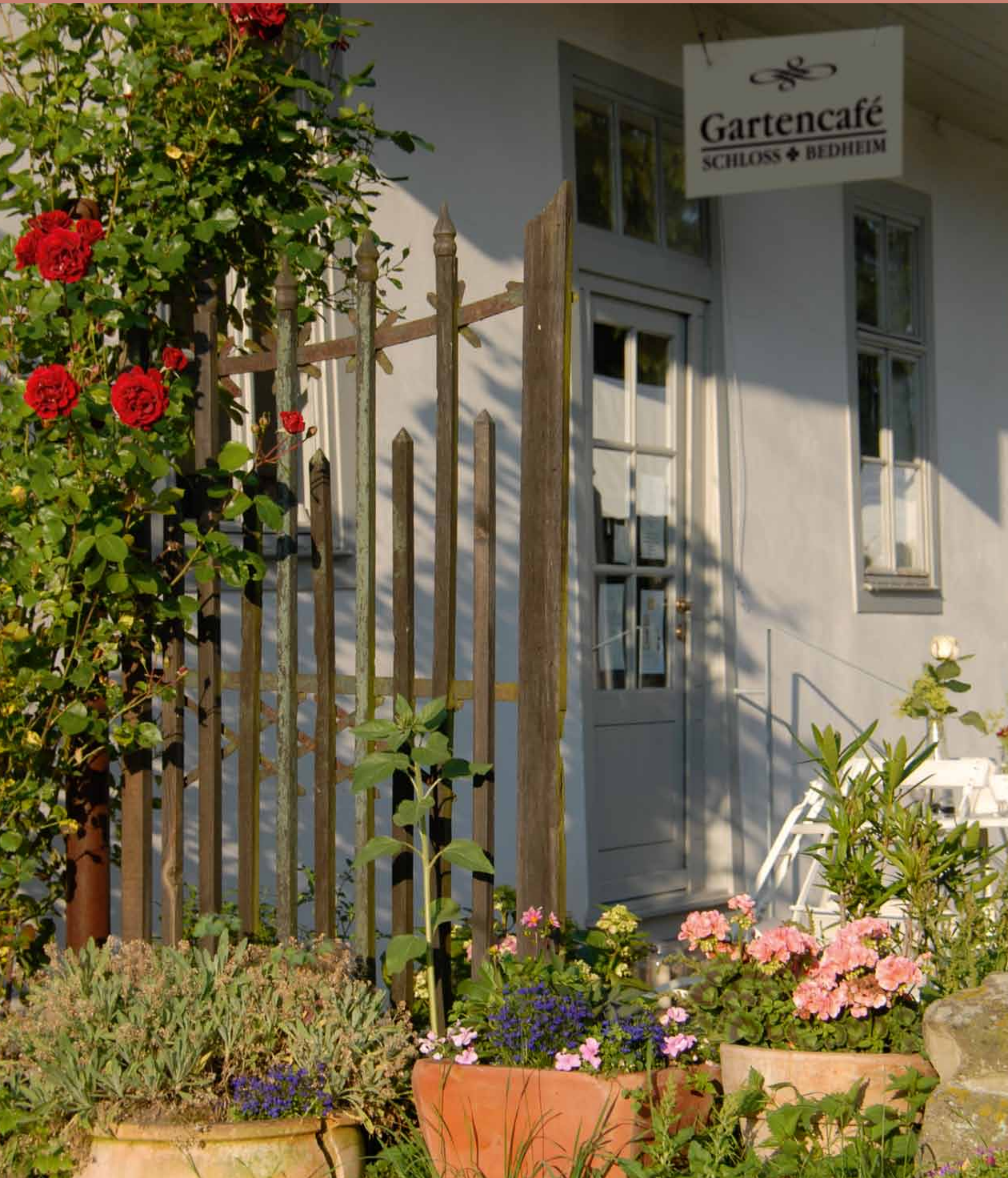
Gartencafé Schloss Bedheim

Es muss auch Spiel und Unschuld sein und Blütenüberfluss, sonst wär die Welt uns viel zu klein und Leben kein Genuss. HERMANN HESSE