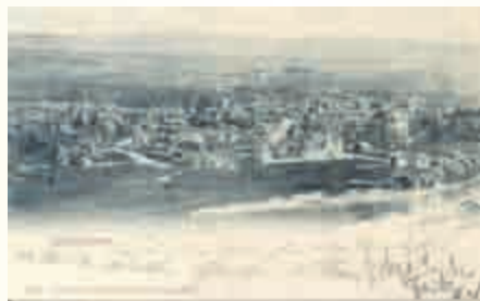
Ansicht von Hildburghausen

Hildburghausen: „Die hiesigen Lazarette wurden heute in früher Morgenstunde noch mit etwa 100 neuen Verwundeten belegt, welche vom östlichen Kriegsschauplatz ankamen.“