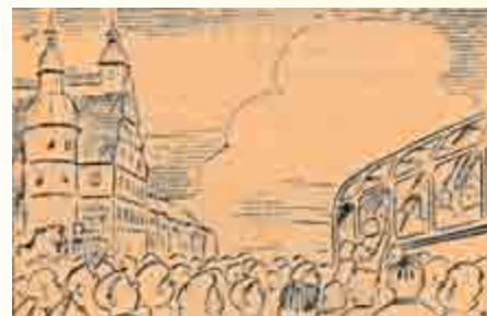
Werbung für die KONSUM-Verkaufsstellen im Landkreis Hildburghausen