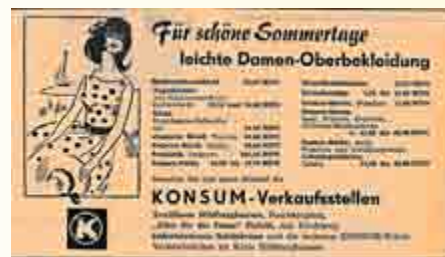
Anzeige „Für schöne Sommertage- leichte Damenoberbekleidung