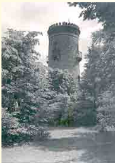
Bismarkturm – aus Sammlung Kreisarchiv KS Gem. 464a / 82

Hildburghausen: „Wie uns mitgeteilt wurde, hat ein hiesiger Herr in seinen Mußestunden einen Rundblickplan vom Bismarkturm auf dem Stadtberg angefertigt und den Plan zur Einsichtnahme für die Besucher des Turmes im Turmzimmer desselben angebracht. Der Plan soll als einstweiliger Behelf gelten, bis der noch der Vervielfältigung harrende Rundblickplan fertig ist.“