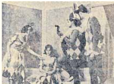
Eine Szene aus „Harlekin und Colombine“

Brünn: „Das Arbeitertheater Suhl gastiert, „Harlekin und Colombine“ heißt das Lustspiel mit dem sich das Suhler Arbeitertheater „Friedrich Wolf“ am vergangenen Sonnabend in Brünn vorstellte. Der VEB Ernst-Thälmann-Werk Suhl, Produktionsbereich Brünn, hat in Gemeinschaft mit der Brünnener LPG diese Kulturveranstaltung für die Gemeinde organisiert. Etwa 150 Zuschauer spendeten herzlichen Beifall für eine gelungene Aufführung. Anschließend spielte die Kapelle Peter Nuber zum Tanz.“