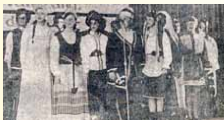
Die Mädchen und Jungen aus Häselrieth bei ihrem Auftritt

Häselrieth: „Höhepunkt und Abschluss des Estradenprogramms der Jungen Pioniere zu ihren Kreiskulturfestspielen war das Auftreten der Mädchen und Jungen von