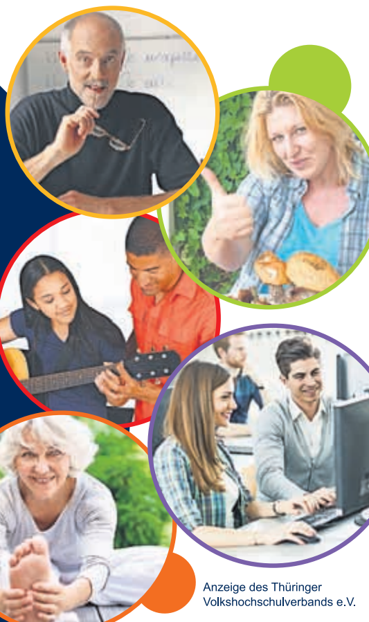
Anzeige des Thüringer Volkshochschulverbands e.V.

Kontakt: kvhs.hildburghausen@vhs-th.de oder 03685 702085.