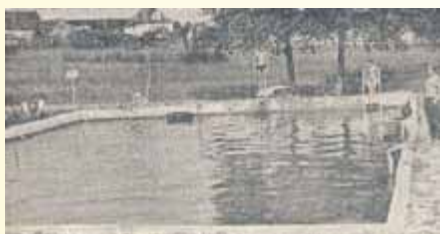
Feuerlöschteich in Albingshausen

Albingshausen: „In Albingshausen entstand durch die Mithilfe der Bevölkerung dieser Feuerlöschteich. In freiwilligen Einsätzen wurde damit ein Wert von 17500 MDN geschaffen. Übrigens wird dieser Teich, der 460 m 3 Wasser fasst, vor allem von der Jugend gern als Bademöglichkeit genutzt.“