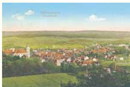
Gaswerk Hildburghausen (rechts unten auf der Karte)