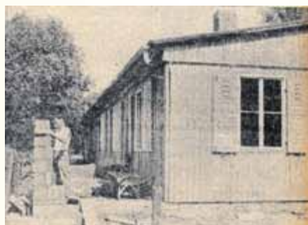
Der zukünftige Betriebskindergarten

mit Schlafräum, zwei Gruppenräumen und einem Turnraum, in dem hauptsächlich die Kinder des Pflegepersonals spielen werden, zum 50. Jahrestag des Roten Oktober seiner Bestimmung zu übergeben.“