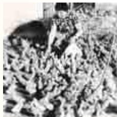
In der Aufzuchtstation

Themar: „Bratpfannen-Aspiranten – Nicht nur für die Mastanstalten unseres Kreises liefert die Brüterei der LPG „Freier Bauer“ in Themar die Entenküken. Insgesamt 44000 Stück sieht der Plan für dieses Jahr vor. In der eigenen LPG werden etwa 4000 Enten gemästet. Die Bruteier für diese Mastenten stammen alle aus der eigenen Produktion, wofür über 500 Altenten (Amerikanische Peking-Enten) zur Verfügung stehen. Die Jahresleistung je Legente beträgt durchschnittlich 139 Eier.“