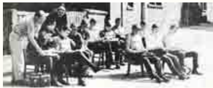
Beim Unterricht im Freien.

Themar: „Bratpfannen-Aspiranten – Nicht nur für die Mastanstalten unseres Kreises liefert die Brüterei der LPG „Freier Bauer“ in Themar die Entenküken. Insgesamt 44000 Stück sieht der Plan für dieses Jahr vor. In der eigenen LPG werden etwa 4000 Enten gemästet. Die Bruteier für diese Mastenten stammen alle aus der eigenen Produktion, wofür über 500 Altenten (Amerikanische Peking-Enten) zur Verfügung stehen. Die Jahresleistung je Legente beträgt durchschnittlich 139 Eier.“