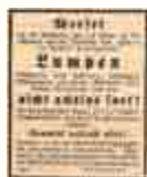
Anzeige des Kriegsamtes

Kriegswirtschaft braucht jedes Stückchen Lumpenmaterial, auch wenn es noch so wertlos erscheint. Sammelt deshalb alles! Verkauft es an die richtige Ablieferungsstelle, des gewerbsmäßigen Lumpensammlers. Dieser liefert alles bestimmungsgemäß an die Sortier- und Wirtschaftsstellen der Heeresverwaltung ab.“