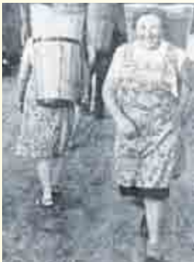
Beim Transport des Festbieres in den Felsenkeller

Streufdorf: „Auch das gehört zur Vorbereitung der 1150-Jahrfeier der Gemeinde Streufdorf. Hier wird, wie es früher noch oft zu sehen war, kein Wasser getragen, sondern Bier, hochprozentiges, eigens für das große Jubiläum in Streufdorf selbstgebraut. Vor wenigen Tagen trafen wir in den Abendstunden Frauen und Männer, die das kostbare Nass unter viel Spaß in den tiefen Felsenkeller trugen.“