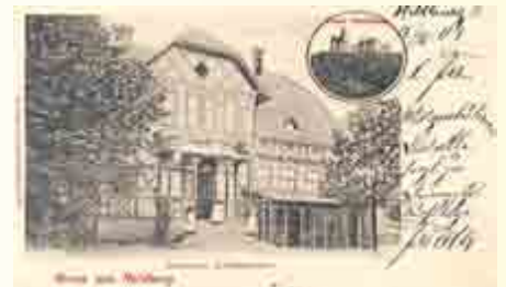
Heldburg – Schützenhaus (KS685)

Heldburg: „Die am letzten Sonntag im Schützenhause von hiesigen Jünglingen und Jungfrauen zum Besten der Heimkehr deutscher Kriegsgefangener gegebene Wohltätigkeitsvorstellung des Schauspiels „Dorf und Stadt“ hatte in jeder Hinsicht einen guten Erfolg. Die sehr gut einstudierten Rollen wurden flott zur Darstellung gebracht. Die Kostüme sowie die Ausstattung der Bühne zeigten ein hübsches und farbenfrohes Bild. Das bis auf den letzten Platz besetzte Haus und das begeisterte Publikum bezeugte seine Anerkennung durch wiederholtes Hervorrufen der Darsteller.“